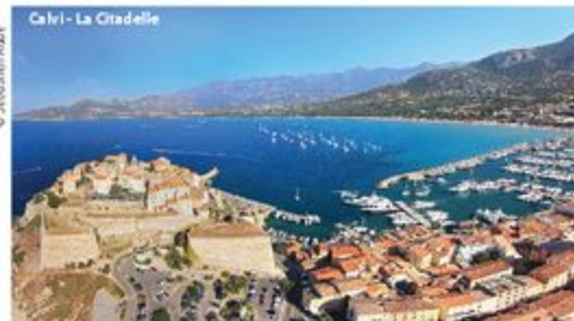
Calvi - La Citadelle

Les hôteliers de Balagne hébergent les participants de votre manifestation et les reçoivent au sein de leurs salles de séminaires. Leur qualité de service répondra à vos attentes. Des Spa permettent de se détendre entre les séances de travail... Les restaurateurs font également preuve de flexibilité et de recherche d'excellence. L'attractivité de la destination est également multiple.