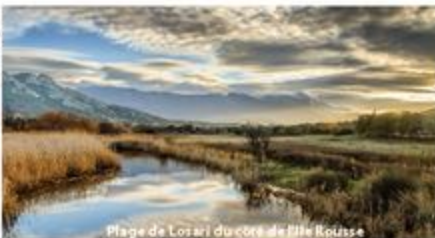
Plage de L'orsari du côté de l'île-Rousse

En raison de l'expertise qu'ils ont de leur territoire, ils peuvent proposer aux organisateurs du tourisme d'affaires un assemblage d'activités couplées à des hébergements, et des espaces de séminaires.