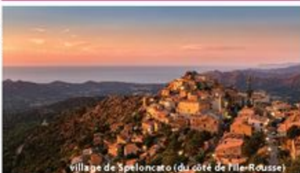
Village de Speloncato (du côté de l'île-Rousse)

Pour faire de votre événement une réussite, les offices de tourisme se positionnent eux-mêmes comme des agences réceptives capables de s'adapter à des demandes très spécifiques.