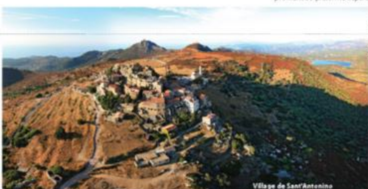
Village de Sant'Antonino

Aujourd'hui, la Balagne constitue encore un véritable grenier de délices qui sait satisfaire les épicuriens et partager sa forte